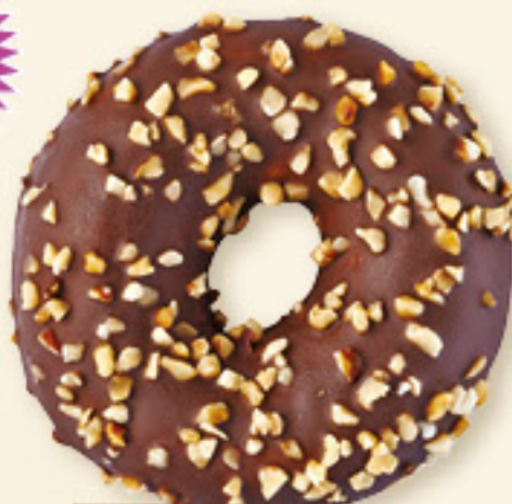
FOURRÉ CHOCO NOISETTE

En 1938, l'Armée du Salut américaine a instauré la journée nationale du donut le premier vendredi de juin.